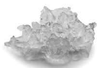
AF 156 Lód płatkowy typu Flake. Zawartość wody 25%